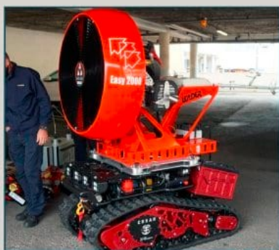
VENTILATEUR GRAND DÉBIT