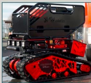
PANIÈRE DE TRANSPORT