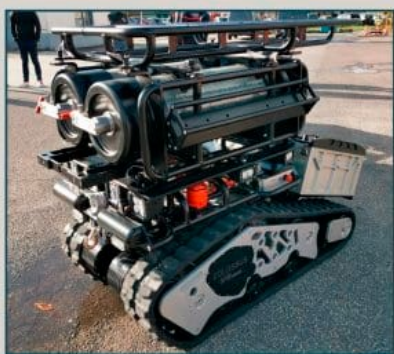
SYSTÈME NARGUILLÉ POUR BOUTEILLES D'AIR