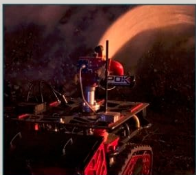
CANON À EAU