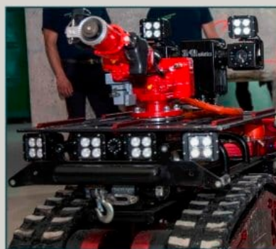
TOURELLE VIDÉO 320°