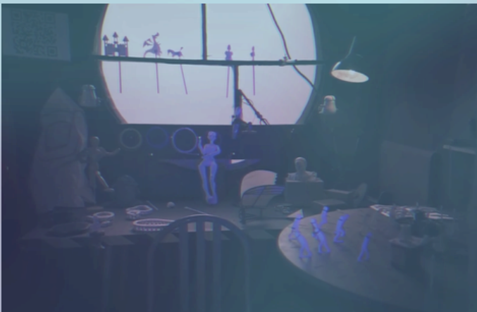
Installations interactives conçues pour "La fête foraine numérique"